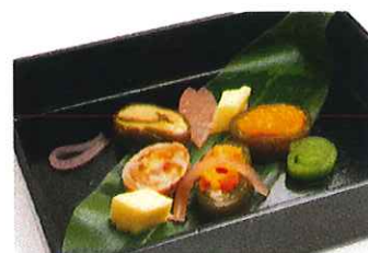
「嚥下食メニューコンテスト2015」 最優秀グランプリ受賞作品 「南茅部産真昆布を使用した昆布巻き寿司 といかめし」