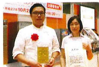
「嚥下食メニューコンテスト2015」 最優秀グランプリ受賞 函館脳神経外科病院